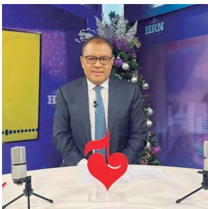
Con un nuevo look celebró los 90 años de HRN ... el reconocido periodista ROSENDO GARCIA... Le lucen los anteojos se ve muy bien y renovado... ¡Esooooo Chendo que guapo!