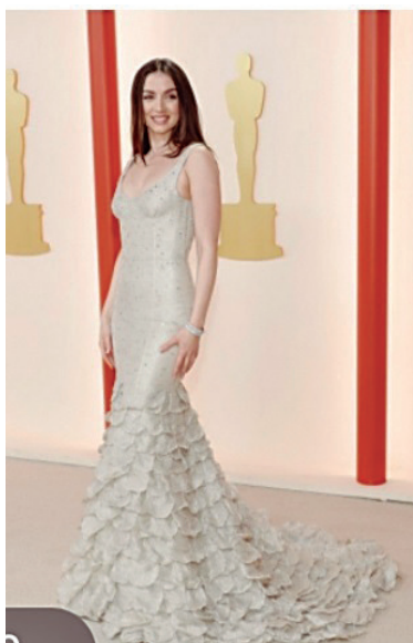
ANA DE ARMAS

E l domingo pasado se entregaron en el Teatro Dolby en Los Ángeles, California, los reconocimientos más importantes que se otorgan a los involucrados en las producciones de películas, actores, directores, guionistas, técnicos y toda la parte creativa que involucra el Séptimo Arte, una gala vista por más de 100 millones de personas en el mundo entero.