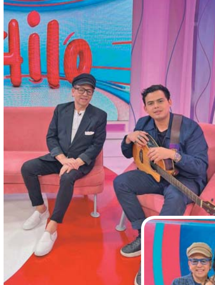
Cantante RODOLFO BUESO