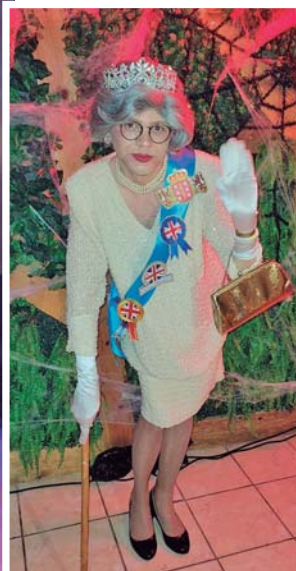
LA REINA ISABEL